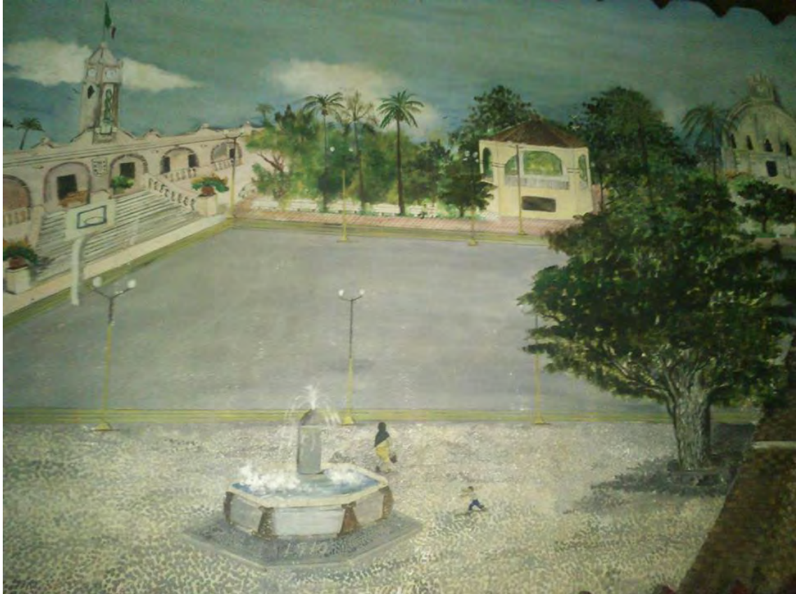
Ilustración de la Plaza Central de Tetecala, década de 1970